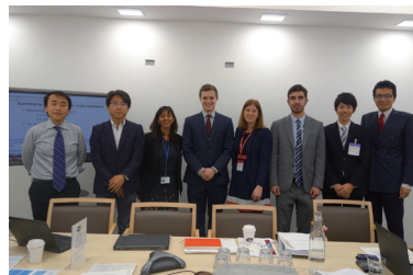
政策評価に関する海外調査での一コマ

「活躍の場の広さ」があげられます。私の場合、行政相談業務で様々な市町村を訪れ、地域の方々と一緒に地域の課題について議論する機会に恵まれたほか、政策評価制度の企画立案業務で諸外国の政府職員と意見交換する機会に恵まれました。このように、活躍の場はローカルなものからグローバルなものまで幅広く用意されていますので、好奇心旺盛な方にオススメです。