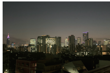
統計局から見える新宿の風景

できるだけ苦手な分野を作らないことを意識しています。少しでも知識があったり、得意な業務に対しては良いアイデアがどんどん湧いてきて作業も捗り楽しくなってきます。ですので、どんな仕事でもまずは逃げずにやってみて、その中から少しでも知識や経験値を吸収しようと考えています。