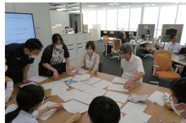
インターンシップ生との交流

統計調査は、ご回答いただく方々を始め、地方公共団体の方々、調査員の方々、その他多くの方々のご尽力があって初めて調査結果を公表することができます。また、調査結果は誰もが利用することができます。多くの方と作り上げて多くの方の役に立つ統計調査、少しでも興味がありましたらぜひ総務省を訪れてみてください。